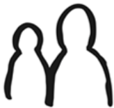
▲信愛塾のシンボルマーク

現在、横浜市に暮らす外国人は10万人を超えています。南区は外国人住民が3番目に多い区。言葉や習慣の違いから、孤独や不安を感じている子どもたちの居場所の運営に長年取り組んでいるのが、今回、講演していただいた「NPO 法人在日外国人教育生活相談センター・信愛塾」さんです。講演会には60名が参加し、熱心にお話に聞き入りました。