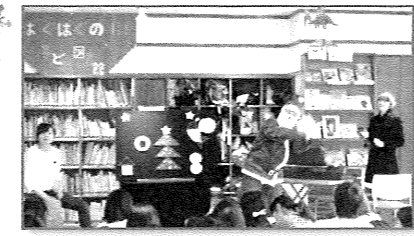
※パネルシアターはなんと運営メンバーの手作りです！素敵なクリスマス会をありがとうございました！

去る12月15日(金)、はぐはぐの樹オリジナルクリスマス会が開催されました。毎年クリスマス会は、はぐはぐの樹利用者から「企画・運営メンバー」を募集し、力を借りて開催しています。2017年度は2名が手をあげてくれました。「来てくれた方も私たちも楽しいクリスマス会になるように」と企画をし、当日まで一生懸命練習をして本番を迎えました。緊張していたメンバーも、お子さんや利用者の皆さんが歌やリズムに合わせて楽しそうに参加する姿をみてとても嬉しかったそうです。笑顔いっぱいのおすてきなクリスマス会になりました。 また、お土産の折り紙サンタさんは地域の方が作ってくれました。温かみのある素敵な贈り物をありがとうございました。